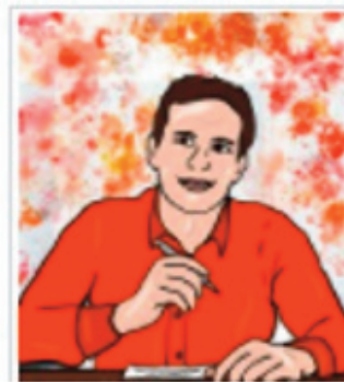
A proposito di