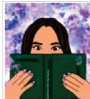
Letto per voi