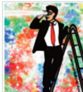
DOC in Direzione Distorta e Consapevole