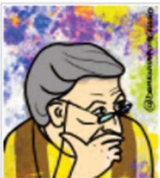
La Parola della Domenica